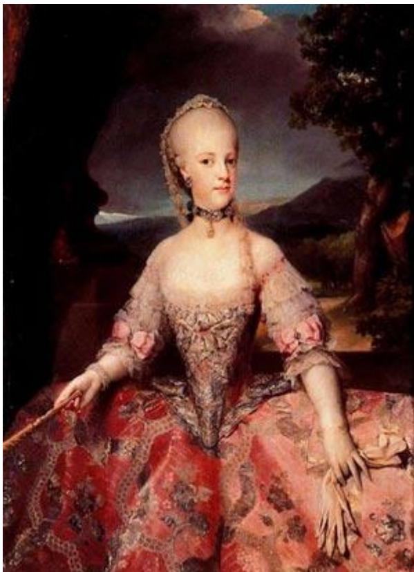
Maria Carolina d'Asburgo

stesso Vanvitelli. Il rifornimento idrico era garantito dall'acquedotto Acqua Carolina, realizzato anch'esso dall'architetto napoletano.